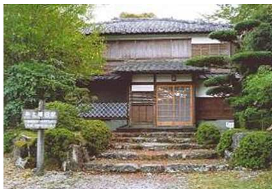
昭和の森へ移築された井上靖旧居