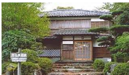
井上靖旧居(伊豆市)

徒歩や馬車で往来していた街道も、大正5年（1916年）にはバスが運行し、地域はさらに活気づいた。踊り子一行が歩いたのは、この頃である。当時、険しかった道も、現在は、ハイキングコース「踊子歩道」として整備され、スギやブナ等の木々に覆われたつづら折りの歩道沿いには『伊豆の踊子』の文学碑や川端のレリーフをはじめ、文学作品の舞台にもなっている滑沢溪谷があり、浄蓮の滝や河津七滝、二階滝、平滑の滝を始めとする大小さまざまな滝、谷間のわさび田等、踊り子一行が歩いた頃と変わらない風景が残る。滑沢溪谷に聳える、天城の太郎杉は、天城の森の恵みを象徴する山中最大の巨木である。