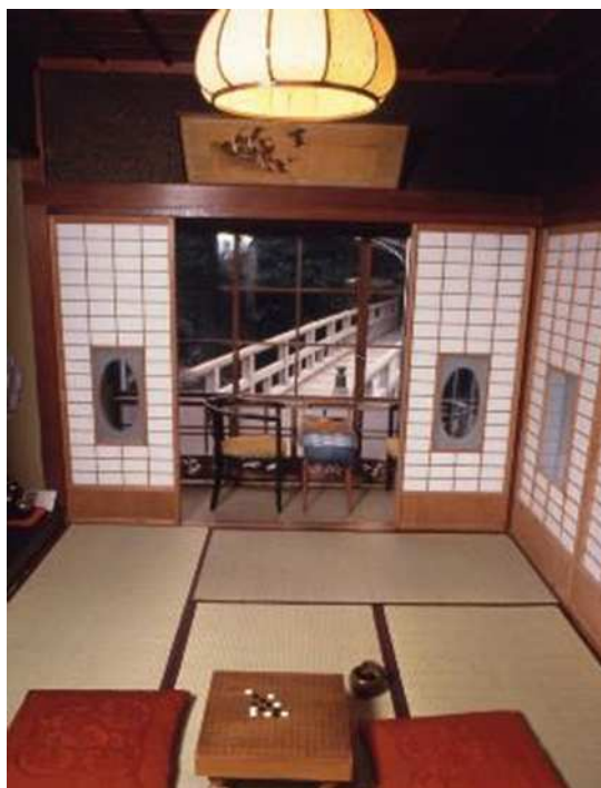
川端が滞在した部屋