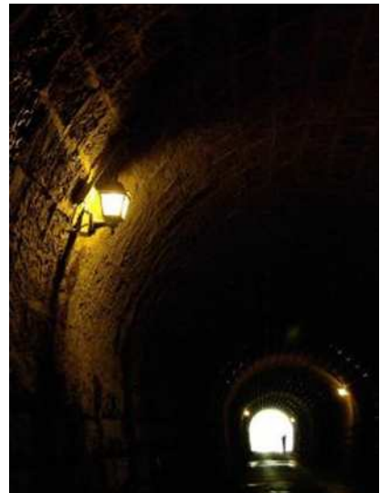
旧天城トンネル (伊豆市・河津町)