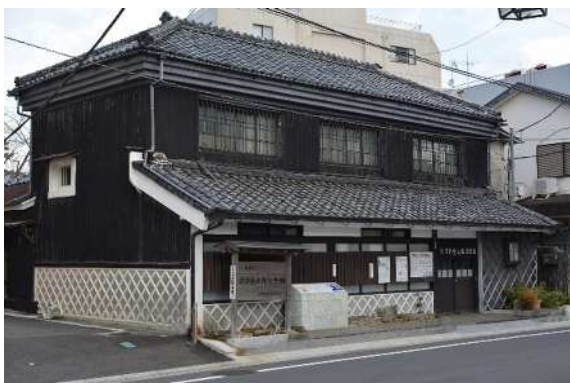
②⑦ 木下圭太郎記念館