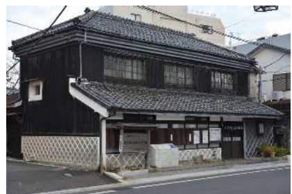
木下杢太郎記念館（伊東市）