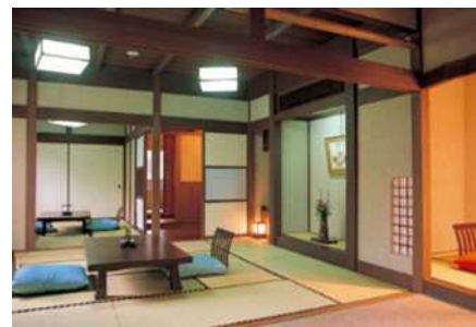
いづみ荘実篤の間（伊豆の国市）