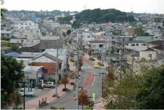
⑦ 見付宿のまちなみ (旧東海道と見付宿)