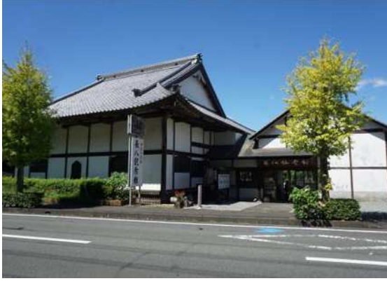
⑰長八記念館(浄感寺)