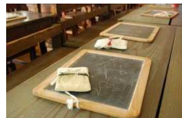
再現された教室の様子（旧見付学校）