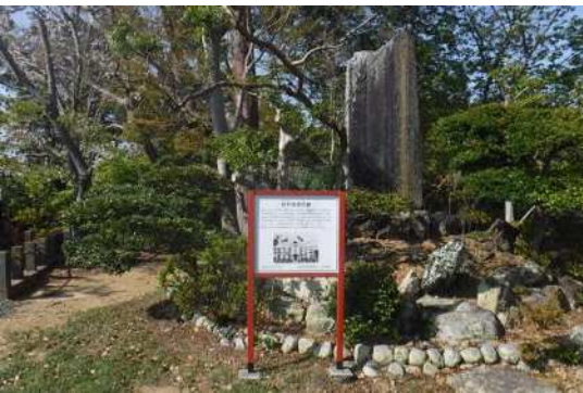
⑨ 坊中学校跡石碑 (医王寺)