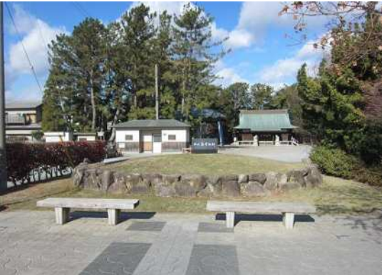
⑧ 西之島学校石碑 (若宮八幡宮)